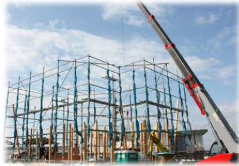
写真はイメージでサウナ・住建とは関係ありません

皆様、連日の除雪作業、お疲れ様です。雪国の宿命ですかね。毎年、必ず雪は降りますね・・・その分、春の到来が何よりうれしく、喜びを感じます。