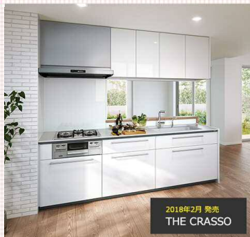
2018年2月 発売 THE CRASSO