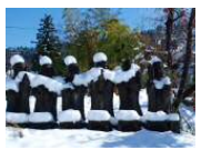
山古志地域のお地藏さま