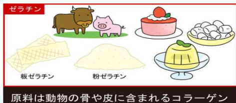
原料は動物の骨や皮に含まれるコラーゲン