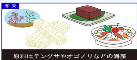
原料はテングサやオゴノリなどの海藻

ようやく梅雨が明けて暑くなりました。夏はやっぱり、ゼリーやプリンなどひんやり冷たいお菓子がいじりです。『寒天』と『ゼラチン』どちらも、プルプルとしたためらかなお菓子作りなどに使われる凝固剤です。どんな違いがあるのか見てみましょう。