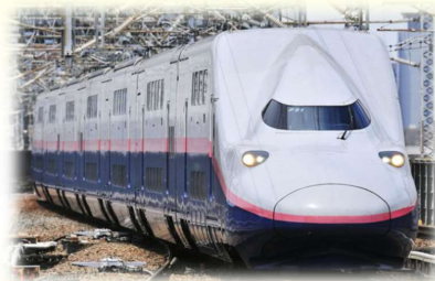
日本唯一のオール2回建て新幹線車両「E4系」(JR 東日本より)