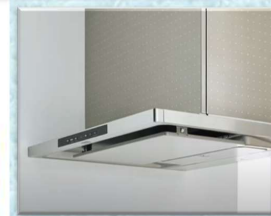
クлинаップ・自動洗浄機能付き 洗エールレンジフード