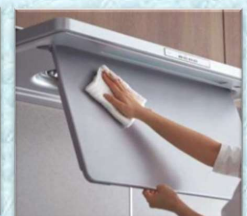
TOTO・フィルターなしゼロフィルターフードeco