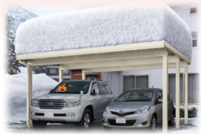
ジーポート neo 積雪 150cm(L)Aタイプ 基本セット/2台用 55-55LA 角柱・横材なしタイプ ホワイト色