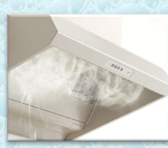
トクラス・小型フィルター付きサイクロンフードⅢ

などのお手入れしやすいレンジフードが出ていますが、何も掃除しなくて良い換気扇なんてありません。日頃のコマメなお掃除が一番、キレイへの近道ではないでしょうか。