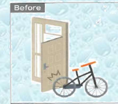
開け開めのジャマになるから物を置けない...