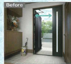
袖や子扉が閉めつばなしでせまく感じる...