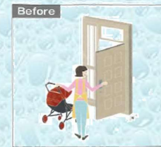
一歩下がって扉を開けるのが面倒...