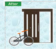
玄関前を有効活用!

玄関引戸のメリットは何と言っても開閉のしやすさです。開閉は扉を横にスライドするだけなので、小さなお子様でも楽々。また、ドアよりも開口幅が広がるので、日常の荷物の出し入れを楽に行えます。車椅子だって、楽に通れます。YKK APの「かんたんドアリモアウトセット玄関引戸」は壁を壊さない工事のため、短時間で施工が完了します。どうぞお気軽にお問合せください。