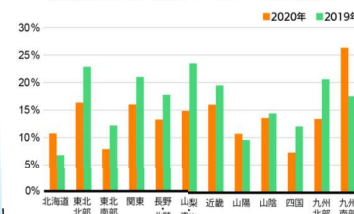
花粉症の症状が辛い人の割合