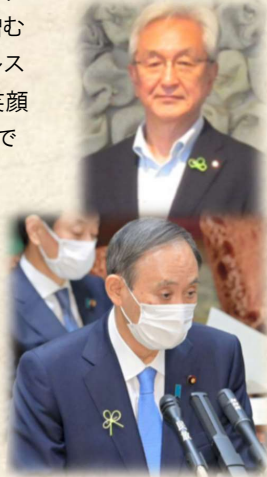
有名人がつけると効果的！！