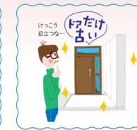
中古住宅を買ってキレイにリノベしたけど...

こんなお悩みありませんか？ 「帰宅するたび、なんだかうれしい！」を実現しませんか？ YKKAPのドアリモなら、たった1日でリフォームできます。