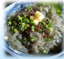
湘南名物しらす丼

共通しているのはどちらも「鰯の稚魚を使った食材である」ということ。鰯は主に、カタクチイワシを使用しますが、季節によりマイイワシやウルメイワシなども使用されるそうです。呼び名の違いは乾燥度の違いから。