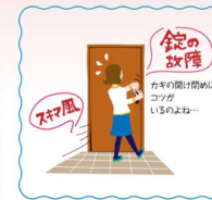
玄関の老朽化、もうこれ以上ほつけない...