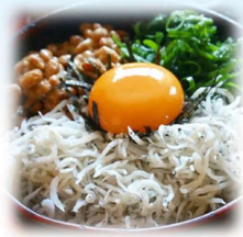
一般的なしらす丼