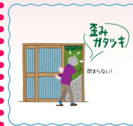
古い玄関は毎日がストレス...