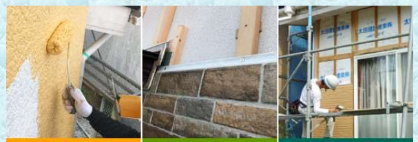
外壁塗装 外壁カバー工法 外壁の張替え

建物の用途や地域の気候条件によって異な りますが、築年数がある程度経過してくる と、外壁がひどく汚れてきたり、塗膜のはが れ、ひび割れなどが目立ち始めてきます。 愛着ある我が家を長く 綺麗に保つため、適切 なタイミングを見て、 外壁工事をしましょう。